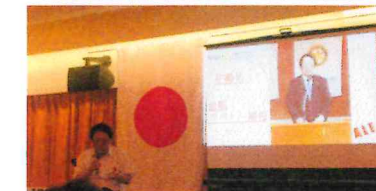
中締め 金鹿ガバナー補佐